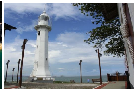
FAROL DE SANTA LUZIA