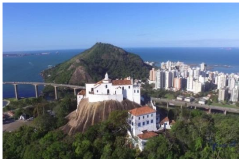
CONVENTO DA PENHA