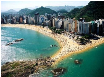
PRAIA DA COSTA