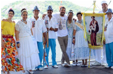
BARRA DO JUCU